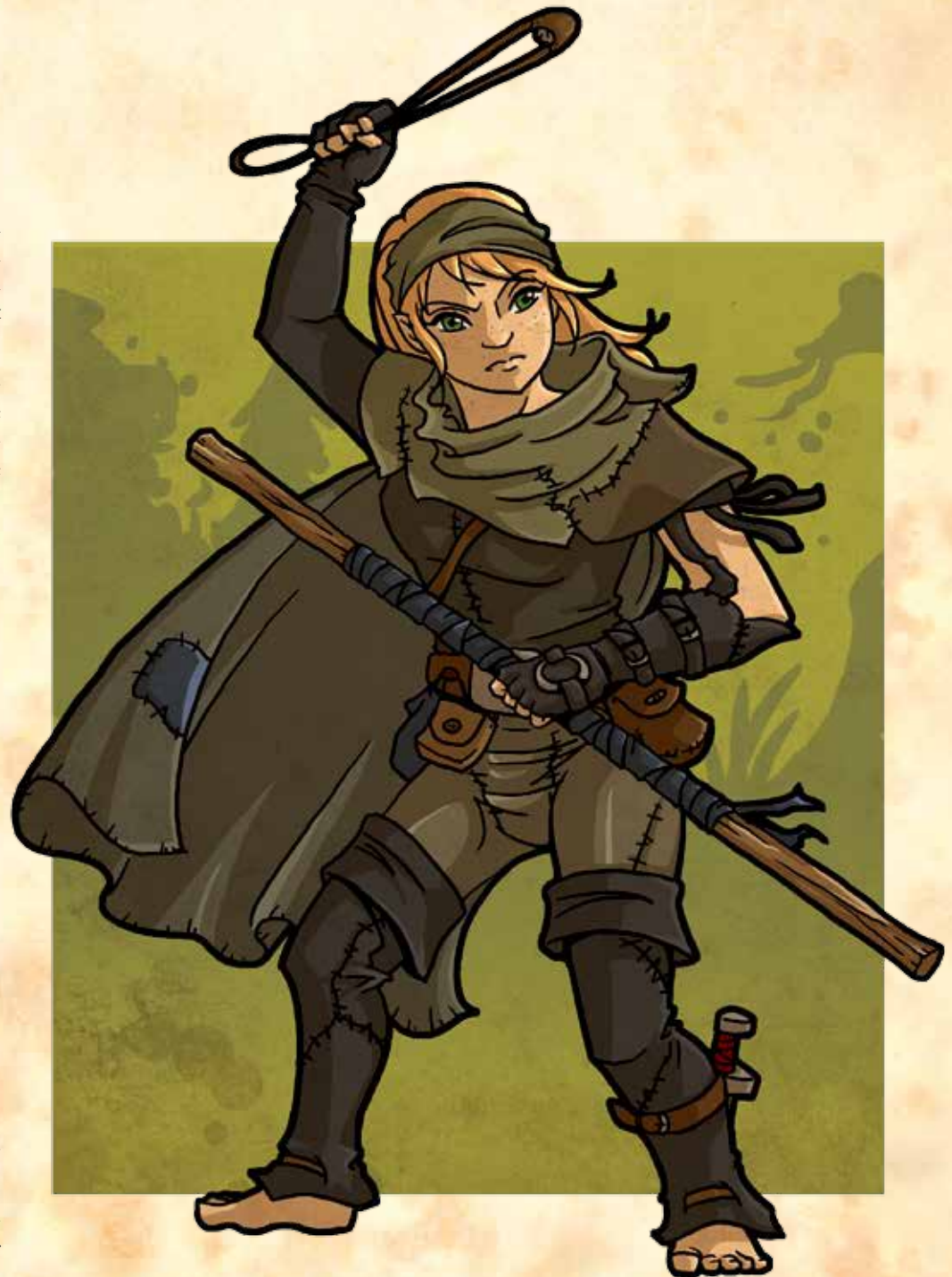
Das Wunder von Schwarzfurt

Halbling-Glück: Wenn der Held Schicksalspunkte ausgibt, um bei einer Herausforderung zusätzliche Würfel zu werfen, und keiner dieser zusätzlichen Würfel zeigt einen Erfolg an, so bekommt der Held automatisch einen zusätzlichen Erfolg geschenkt.