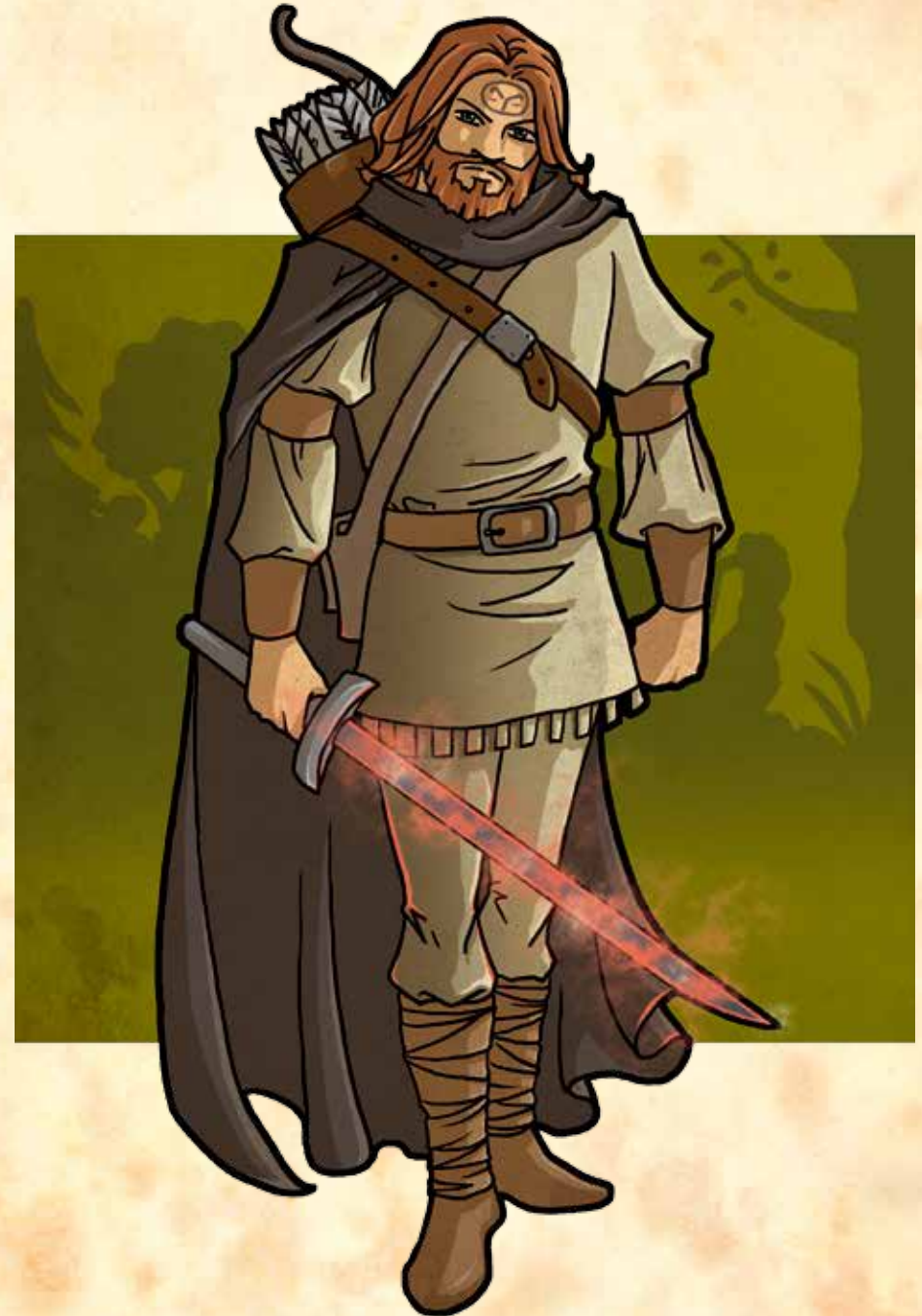
Das Wunder von Schwarzfurt

Universeller Kämpfer: Bei der Verbesserung von Fertigkeitswerten mithilfe von Erfahrungspunkten am Ende eines Abenteuers darf der Held den Nahkampf- und den Fernkampfwert gleichzeitig um +1 anheben, und zahlt dafür trotzdem nur so viele Erfahrungspunkte wie für das Steigern einer einzelnen Kampffertigkeit.