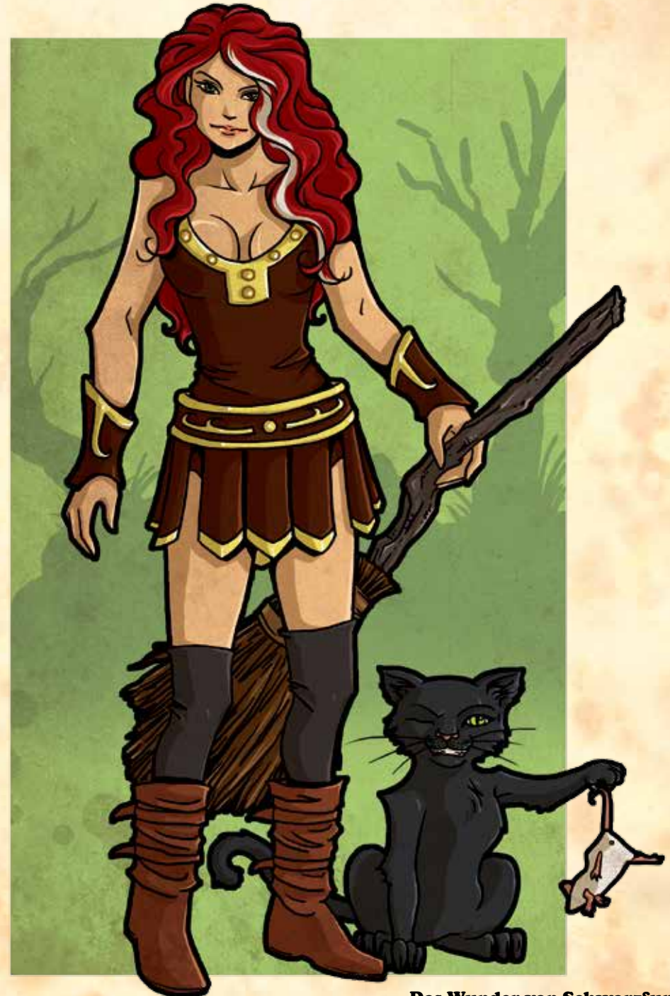
Das Wunder von Schwarzfurt

Hexenkater: Die Hexe darf einmal pro Kampf 1 Schicksalspunkt einsetzen, um einen Gegner sofort aus dem Kampf zu entfernen. Dieser Gegner wird von dem Kater abgelenkt und letzten Endes besiegt. Diese Möglichkeit besteht nicht bei Gegnern, deren Ausdauerpunkte mithilfe der Anzahl Helden berechnet werden.